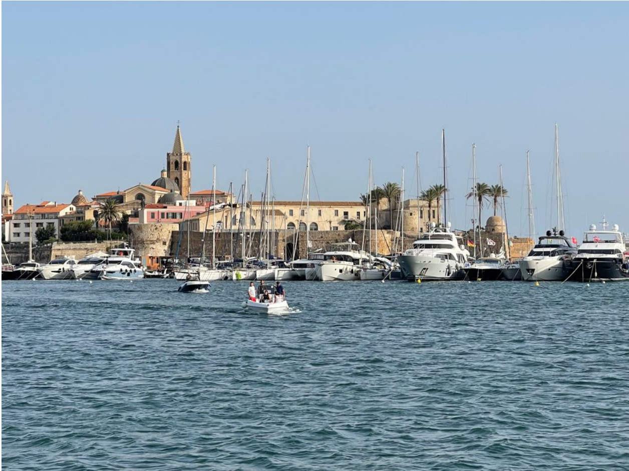
Marina San Telmo. Alghero