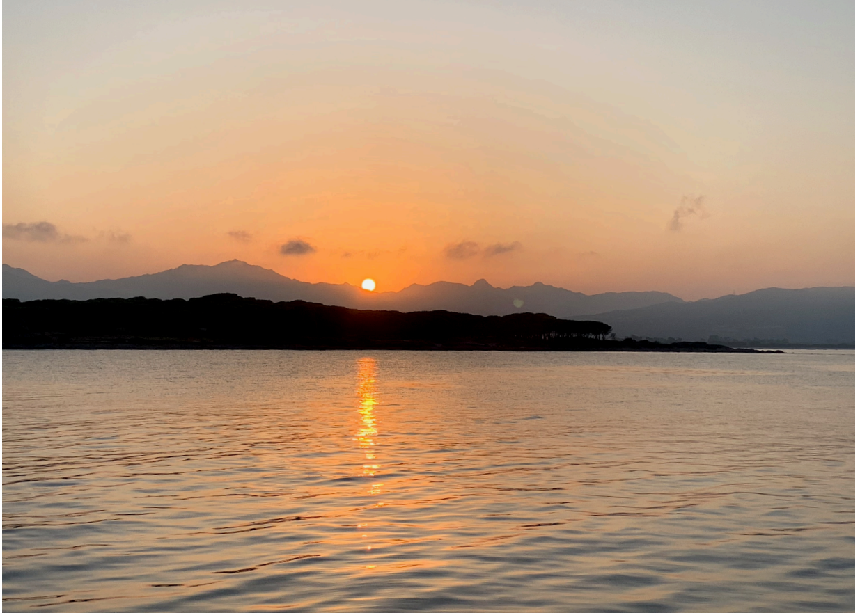
“Cala Santa Ana”