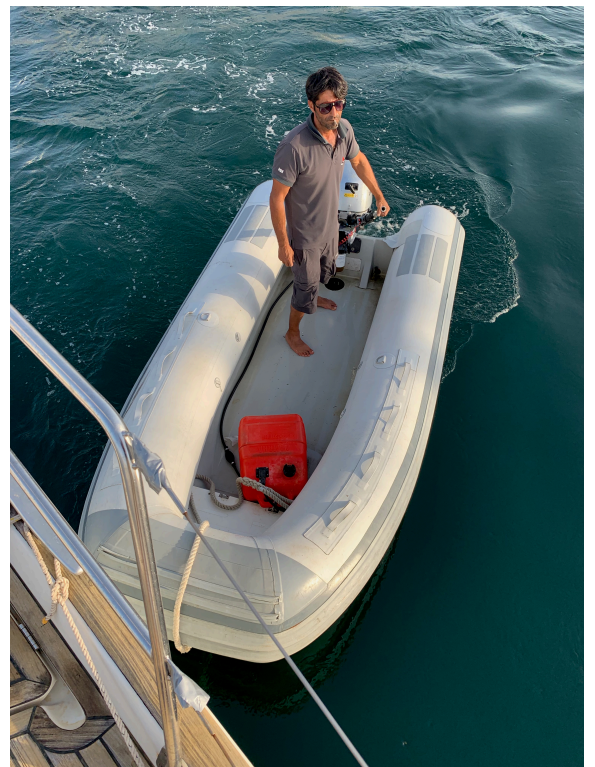
Ayuda en maniobra de atraque